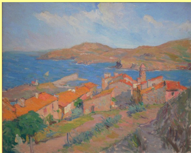
Henri Marre, Collioure huile/toile, coll. Musée d'Art Moderne de Collioure